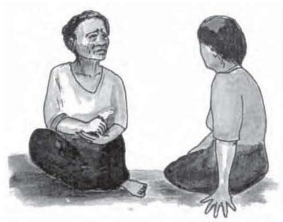
ការពិគ្រោះបញ្ហា ជាសិល្បៈនៃការផ្តល់កំលាំងចិត្ត